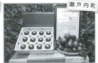
瀬戸内町 パッションフルーツ 200円(1玉)