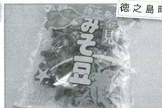
徳之島町 金見みそ豆 600円(30パック)