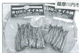
薩摩川内市 きびなごオイル漬(キャノーラ) (オリーブ&バジル)700円

市町村 特産品即売会 (4/27~28 合歓の広場) の取扱商品を 一部ご紹介!