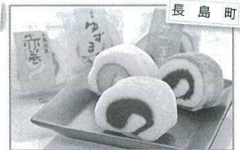
長島町 赤巻き 140円(1個)

※都合により、未入荷・内容変更等もございます。予めご了承ください。価格はすべて税込です。