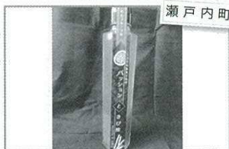
瀬戸内町 パッションきび酢 600円(100ml)