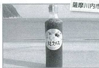
薩摩川内市 サラダ玉ねぎドレスソース 700円(300ml)