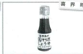
喜界町 喜界島の島そら豆醤油(小) 1,100円(70ml)