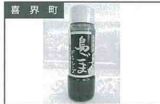
喜界町 鳥ごまドレッシング 700円(200ml)

※都合により、未入荷・内容変更等もございます。予めご了承ください。価格はすべて税込です。