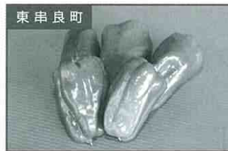
東串良町 ピーマン5個 100円