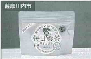
薩摩川内市 桑茶パウダー 1,100円(50g)