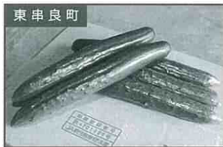
東串良町 きゅうり3本 100円

市町村 特産品即売会 (6/2~3 ゴジラスクエア) の取扱商品を 一部ご紹介!