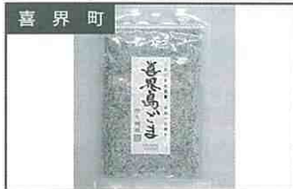
喜界町 喜界島ごま(炒り胡麻) 400円(20g)